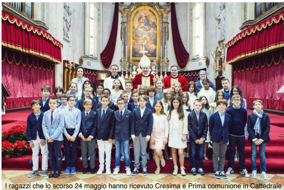
I ragazzi che lo scorso 24 maggio hanno ricevuto Cresima e Prima comunione in Cattedrale

Quest'anno si consolida la catechesi battesimale per i genitori che desiderano dare il battesimo ai loro figli ... Tale percorso continuerà con quattro incontri durante l'anno per tutte le