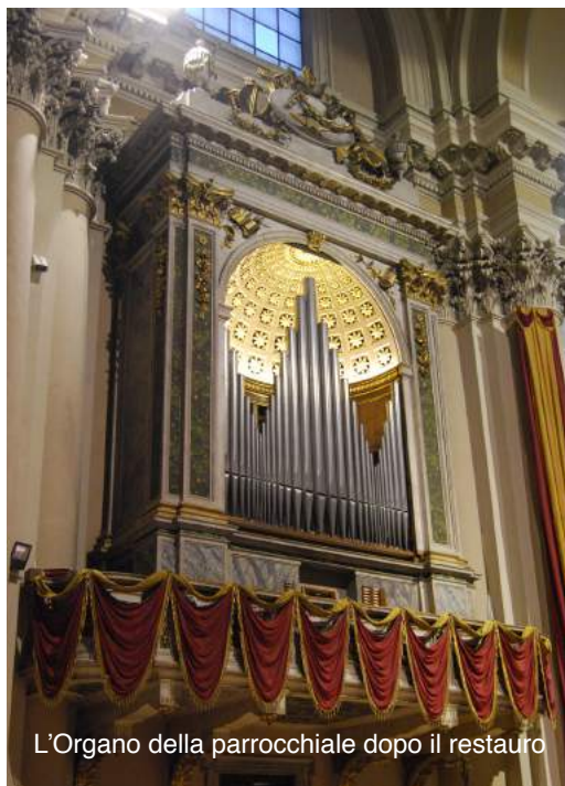
L'Organo della parrocchiale dopo il restauro

restauratore mostrerà tutti i dettagli del complesso lavoro compiuto, concludendo poi la giornata ed il ciclo di manifestazioni inaugurali con il concerto del Maestro Marco Ruggeri alle ore 21.00.